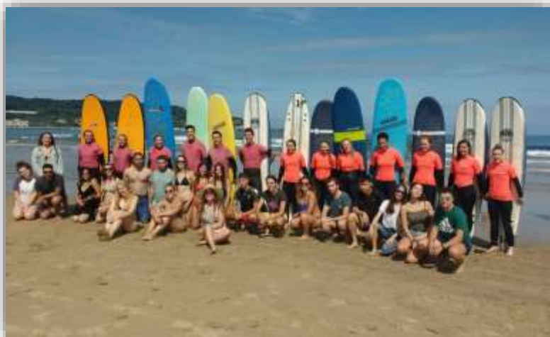
International student orientation programme - 2019

*Si votre université d'origine accepte l'envoi de votre relevé de notes par email, l'enveloppe ne sera pas nécessaire.