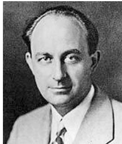
Enrico Fermi (1901-1954)